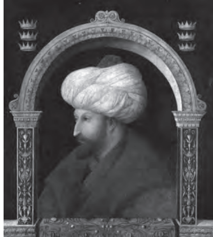
Fatih Sultan Mehmed (The National Gallery UK)

Beş Şehir ’in henüz başında “şehirlerin hayalimizde aldığı çehreler”in, üzerinde düşünülecek şey olduğunu ve bu çehrelerin, insandan insana ve nesilden nesle değiştiğini belirtir yazar. Tanpınar, Yahya